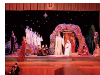
クリスマスページェント