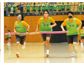
ヨゼフィンピック