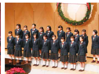
クリスマスキャロル合唱コンクール