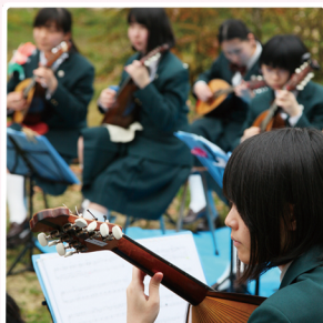
ギターマンドリン部